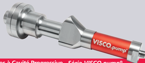
Pompes à Cavité Progressive - Série VISCO.pump®