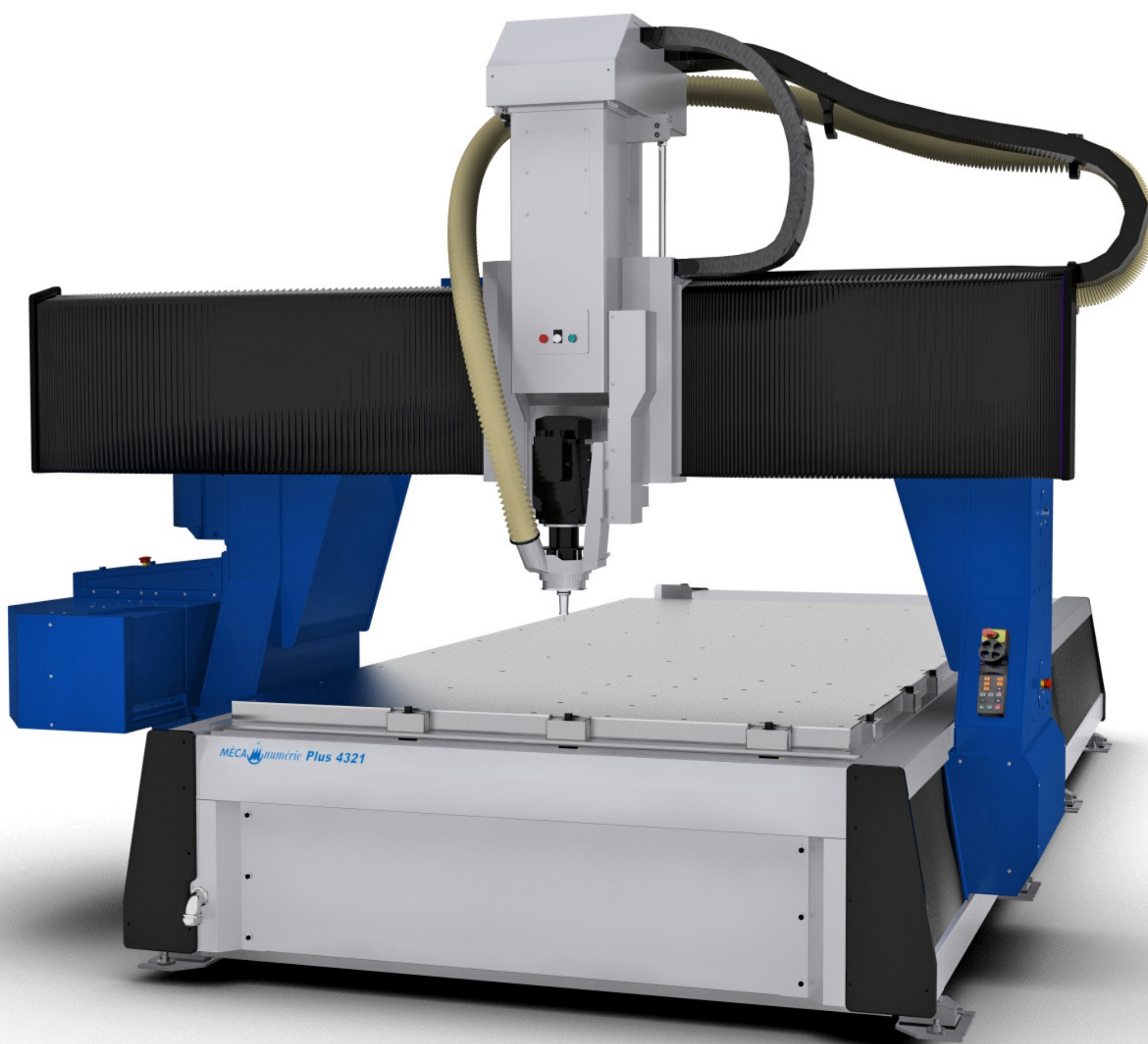
▲ Fraisage UGV - MECAPLUS HP