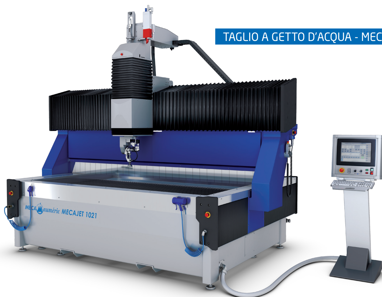
TAGLIO A GETTO D'ACQUA - MECAJET II