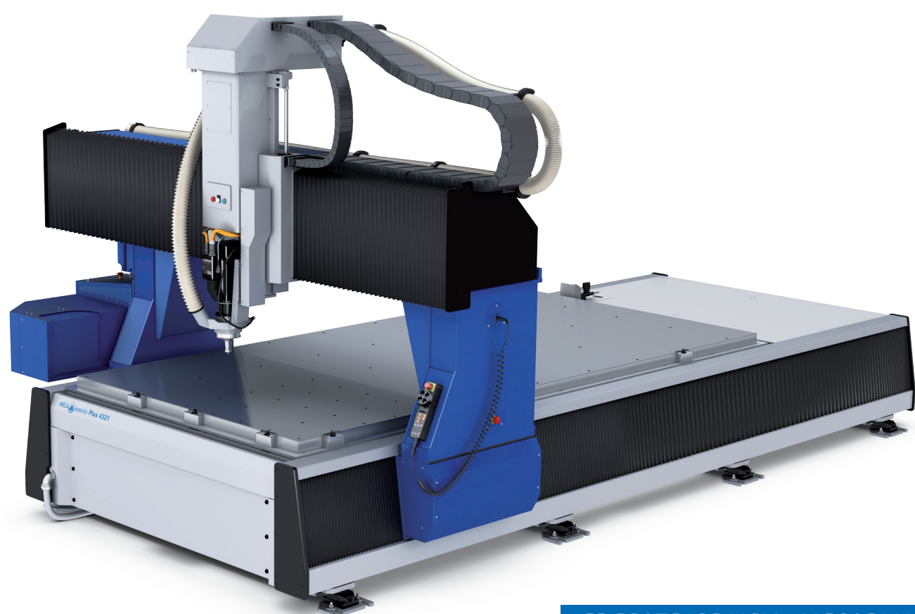
FRESATRICE UGV - MECAPLUS HP