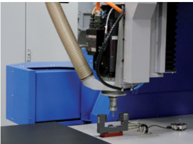
Sistema di misurazione utensile senza contatto (diametro e lunghezza)