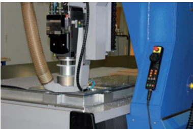
Elettromandri 25kW, coppia massima S1 : 24 mN