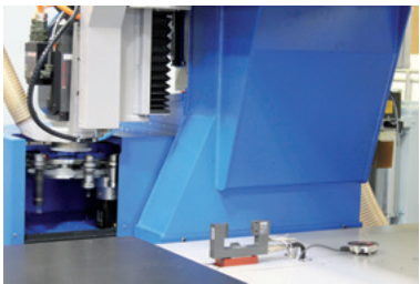
Magazzino da 24 utensili installato sul portale