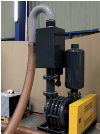
Piano aspirante con turbine multistadio